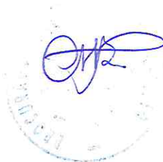
LUAN FRANCISCO MAGALHÃES CLAUDINO OAB/MG 135.124 Procurador do Município